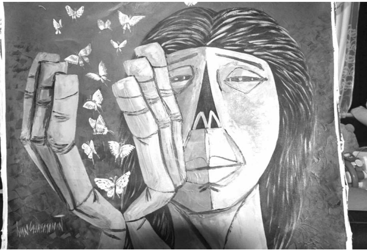
por Ivan Guayasamin

En su pecho, la niñez, de amor un templo te ha levantado, y en él sigues viviendo. Y al latir su corazón va repitiendo: ¡Honor y gratitud al gran Sarmiento! ¡Honor y gratitud, y gratitud!